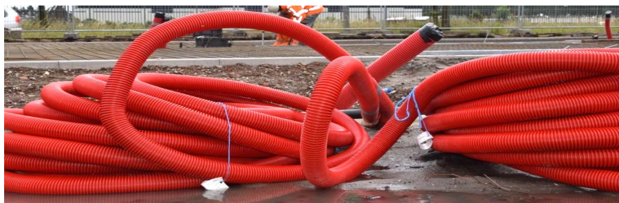
Foto: Toegepaste materialen.

De aannemer legt schriftelijk vast wie, wanneer, wat heeft beoordeeld en vastgesteld.