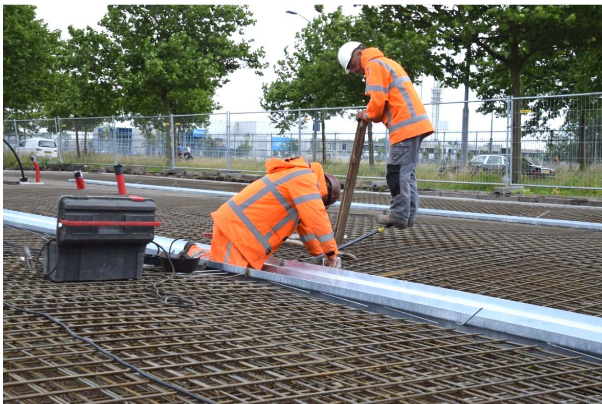
Foto: Aanleg wapening voorziening.