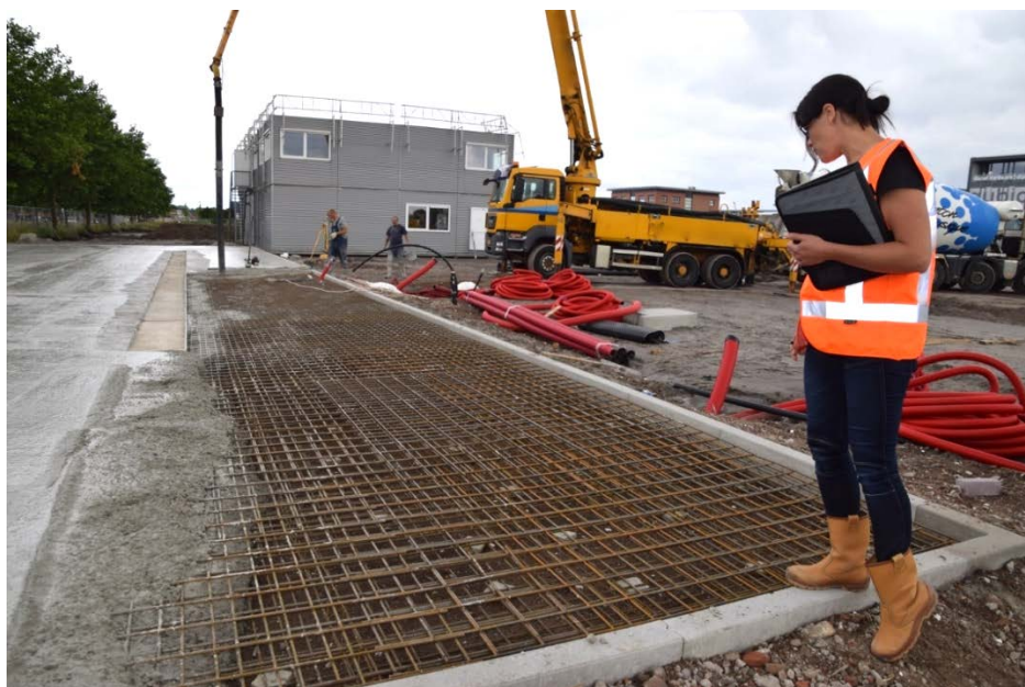
Foto: Kwaliteitscontrole van het werk