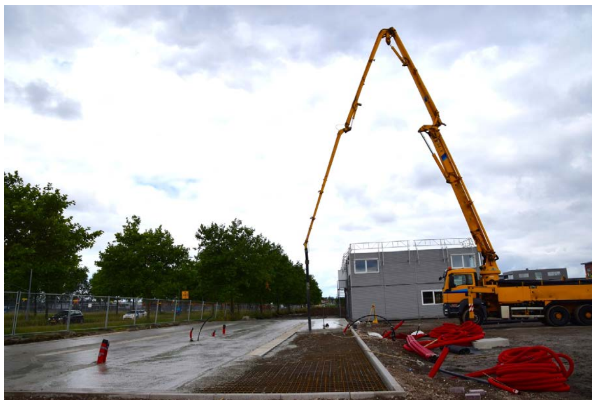
Foto: Storten van een voorziening.

Wanneer vanuit een wettelijk kader (zoals een omgevingsvergunning of een PGS-richtlijn) specifieke eisen aan de vloestofdichte bodemvoorziening worden gesteld (bijvoorbeeld aan minimale afmetingen), dan worden deze eisen aanvullend op de bepalingen in de beoordelingsrichtlijn door de aannemer gehanteerd.