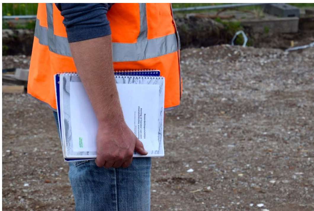
Foto: Toepassen BRL in de praktijk